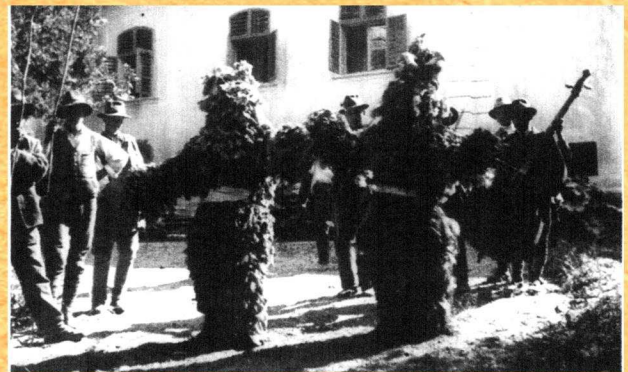
Păpălugara în Dăbâca. Foto: Gidofalvi Eva, 1937

„Așa să fie hotarul de ud - cum ud eu Păpălăgura - Și cum e omul ăsta îmbrăcat - să fie hotarul de bogat”. Aceste practici s-au ținut cu precădere înainte de al doilea război mondial, după care s-au simplificat și a rămas doar obiceiul stropitului cu apă.